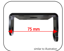
similar to illustration