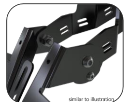
similar to illustration